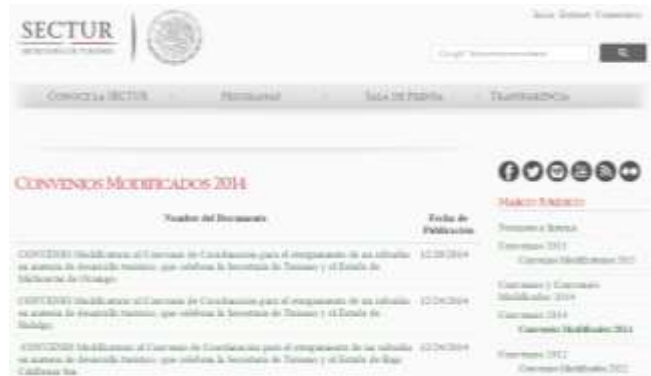
Ilustración 5. Acuerdos de la Secretaría de Turismo 2014