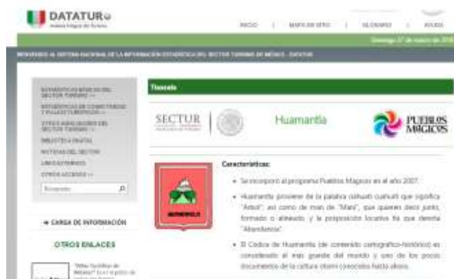
Ilustración 2. Huamantla Pueblo Mágico